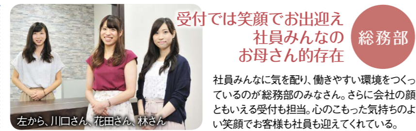
受付では笑顔でお出迎え 社員みんなのお母さんの存在 総務部 社員みんなに気を配り、働きやすい環境をつくっているのが総務部のみなさん。さらに会社の顔ともいえる受付も担当。心のこもった気持ちのよい笑顔でお客様も社員も迎えてくれる。