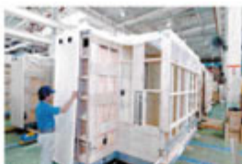
I.S.O認証工場での組立作業

複雑な工程の水廻り一式を工場生産徹底管理。現場では据え付けるだけ! 大幅時間短縮、完全製品管理!