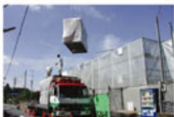
クレーン吊り上げ現場搬入