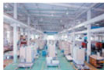
出荷を待つ完成ユニット