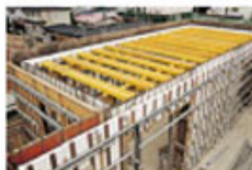
型枠代わりの内壁断熱材