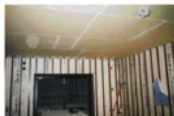
魔法瓶のような高気密室内空間