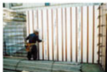
現場での組み立て作業