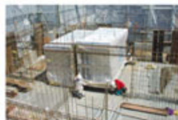
現場据え付け作業