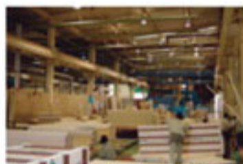
I.S.O認証工場での加工作業

コンクリートを流し込むときの型枠に、断熱材を使用。高性能で、しかも通常作業のコストを約30%カット。