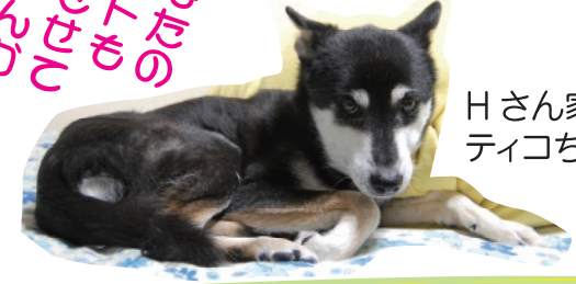
Hさん家の ティコちゃん