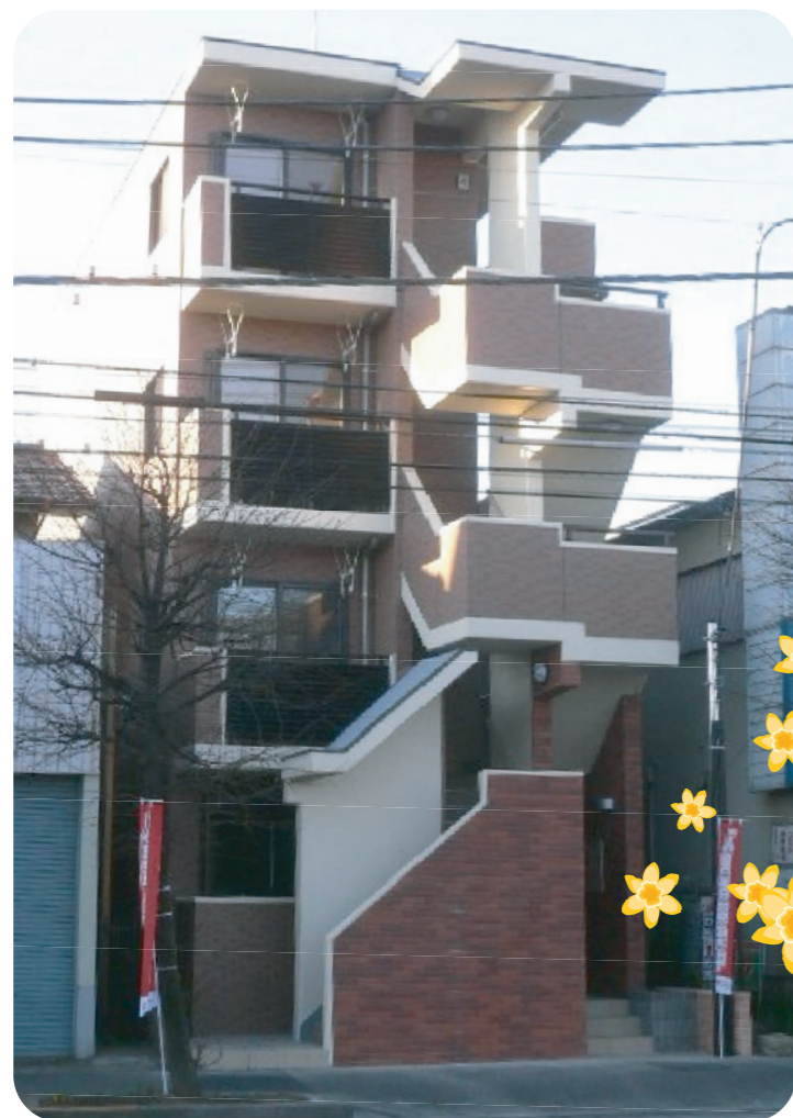
▲現代的なK様の賃貸マンション ARIA(アリア)