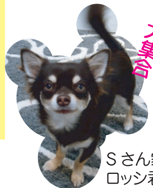
Sさん家の ロッシー君