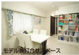
モデル兼打合せスペース