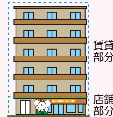
○店舗併用賃貸マンション

立地条件が良い場合には店舗併用マンションをご提案。営利目的の店舗は利回りで有利になる事が期待できます。店舗収入+家賃収入で安定した経営が期待されます。自身のお店のお建て替えて賃貸を併用するケースも多くあります。