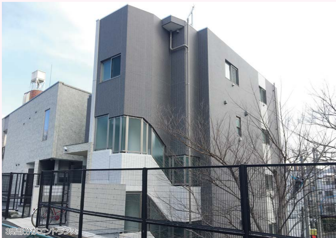
3階部分がエントランス