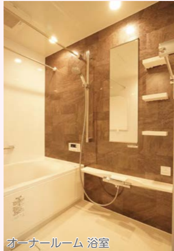
オーナールーム 浴室