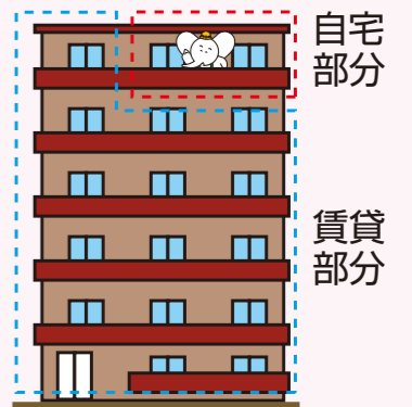
○自宅併用賃貸マンション

現在お住まいのお土地を活かしたご提案。建て替えに合わせ賃貸マンションを建設すれば、その担保能力から自己資金ゼロで建築ができ、さらに新築住宅のローンを抱えた将来への不安もなくなります。節税効果やローン返済後の収入も期待されます。