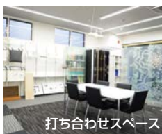
打ち合わせスペース